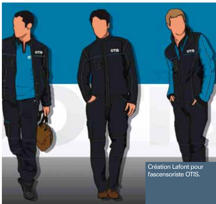
Création Lafont pour l'ascensoriste OTIS.

VÊTEMENTS DE TRAVAIL : FAITES LEUR PORTER VOTRE IMAGE !