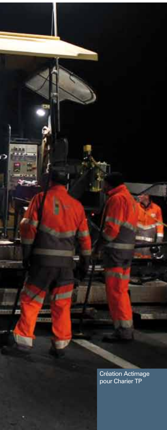
Création Actimage pour Charier TP

Initialement, qu'est ce qu'un vêtement d'image ? C'est un vêtement personnalisé aux couleurs de la société, qui permet d'identifier clairement une entreprise aux yeux de l'extérieur. Ce n'est pas un vêtement qui a pour but de protéger le salarié dans son travail. Il participe à la création et à l'entretien d'un sentiment d'appartenance à une communauté et contribue à la valorisation des salariés. Il y a une vingtaine d'années, ce type de vêtement était principalement vendu aux entreprises du commerce et de la distribution, de l'hôtellerie-restauration ainsi qu'aux grandes entreprises publiques comme La Poste et la SNCF. Il s'agissait donc dans la plupart des cas d'équiper des collaborateurs qui n'étaient pas seulement en contact, mais bien en relation directe avec une clientèle ou un public.